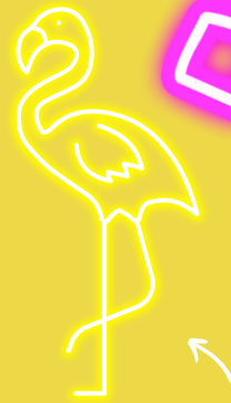
DAS IST UZAY